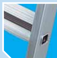
Flänsförsedda steg med plastinlägg