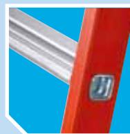
Flänsförsedda fotsteg, olika utföranden